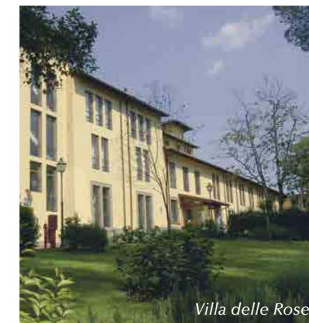
Villa delle Rose

La Lega Italiana per la Lotta contro i Tumori è presente al CeRiOn anche con il servizio "Donna come Prima", dove operano oltre 40 volontarie formate per l'accoglienza dei pazienti e la gestione organizzativa di numerose attività.